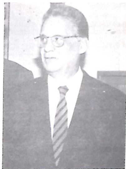
Presidente Fernando Henrique Cardoso