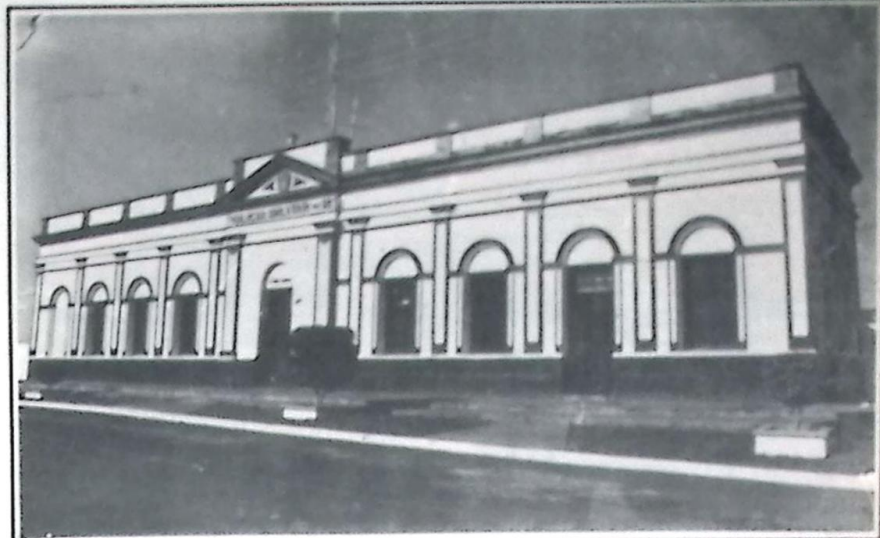
Vista do Prédio Histórico que hoje abriga a Polícia Militar de Bela Vista, totalmente restaurado

- Atuação com rigor no combate a formação de gangs juvenis, recentemente, em uma dessas operações, em conjunto com a Polícia Militar, foram apreendidos sete indivíduos acusados de participarem de um tiroteio durante a realização de uma festa julina na Escola Ester Silva, sendo apreendidos em poder dos elementos nada menos que quatro armas de fogo.