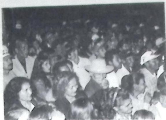
Mais de 1000 pessoas na festa do Dia dos Pais comemorado pelo Supermercado Arco Íris