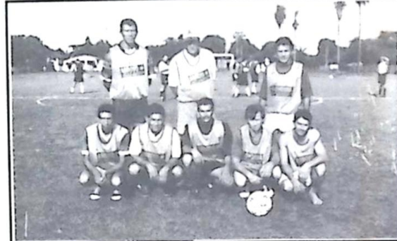
Distrito Nossa Senhora de Fátima - Veteranos