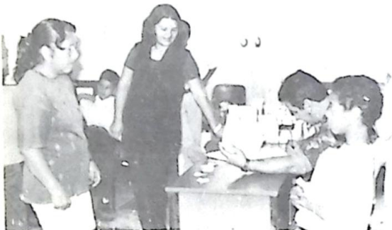
1ª Dama acompanha inscrição dos carentes para receber atendimento...