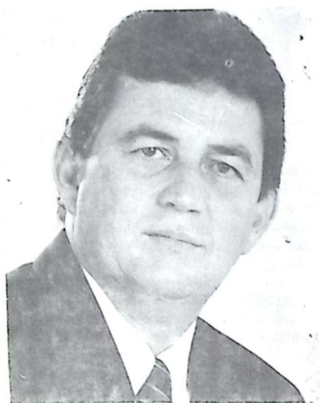
Deputado Estadual Waldemir Moka

Afirmando que a necessidade de criação de novos postos de trabalho é hoje uma das prioridades nacionais, o Deputado Waldemir Moka, candidato à Deputado Federal, assinalou que a industrialização do Estado e o investimento no turismo "são caminhos para o emprego que a população tanto aspira".