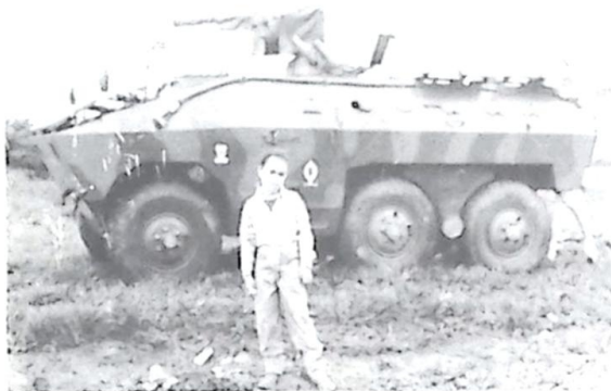
Carro de Combate Cascavel, alvo de curiosidade das crianças