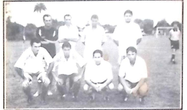
Vila Nova/Previsul/Boa Vista/Planalto - Idade Livre