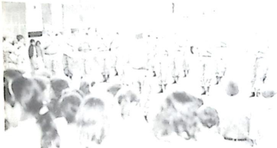
Banda do 10º RC Mec faz a abertura da Operação