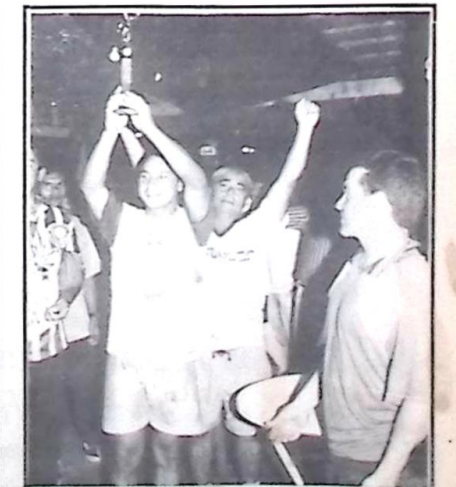
Os campeões no Futebol Socyte Veteranos vibram com o troféu conquistado