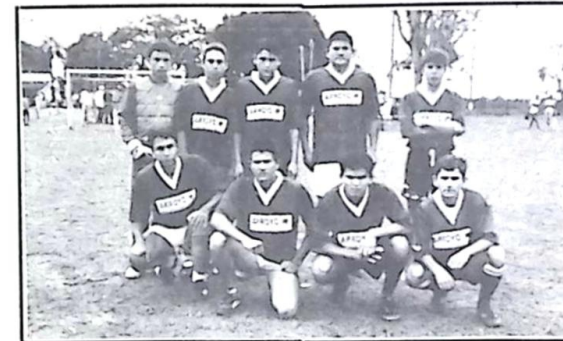
Distrito Nossa Senhora de Fátima - Idade Livre