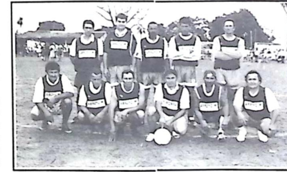
Erva Mate - Veteranos