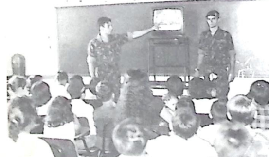
Aulas de vídeo, que tiveram a participação de muitas jovens interessadas na participação da mulher na vida militar