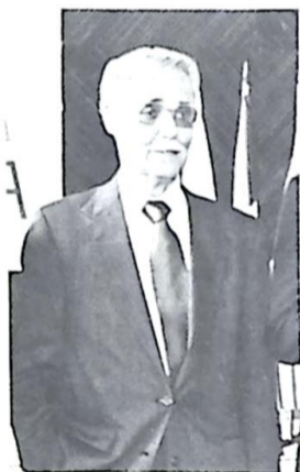
Governador Wilson Martins

O governador Wilson Barbosa Martins, ao participar de uma reunião com servidores públicos, afirmou que o candidato Ricardo Bacha, da Coligação Frente pela Renovação, superou os adversários na corrida sucessória. "Ele tem valor e o povo sabe disso", enfatizou Martins, pedindo porém que haja a união de esforços nesta reta final para que o candidato "se sente na cadeira de governador".