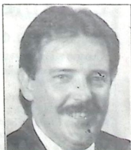
Deputado Antonio Carlos Arroyo

O Deputado Estadual Antonio Carlos Arroyo, Vice-Líder do PTB e candidato à reeleição, intensificou o contato com as suas bases na capital e interior, nesses dias que antecedem as eleições. Nas últimas semanas, várias reuniões foram realizadas com lideranças políticas e comunitárias em todo o Estado.