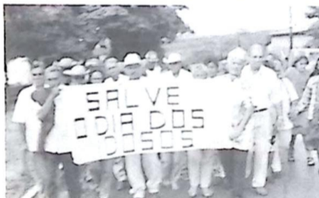
Caminhada pelo envelhecimento saudável, em Caracol

Desde sábado, véspera da grande festa que comemorará o "Dia Internacional da Terceira Idade", era grande a movimentação da Secretaria de Assistência Social, que uniu-se com as irmãs e grupo de jovens da igreja católica, para oferecer uma festa memorável aos idosos cadastrados ou não no projeto Conviver. Página-02