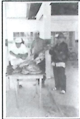
Suculento churrasco oferecido ao meio dia.

É claro que muitos dos trabalhos da primeira dama,