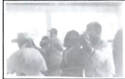
Irmãs participam da festa com...