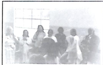
Baile animado pelo Grupo Lendários da Porteira