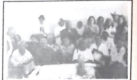
O bolo e a entrega de prêmios à todos que participaram, marcou o final desta memorável festa

um ótimo trabalho na creche e asilo municipal, sempre está pronta a encaminhar os carentes que necessitam de atendimento médico no período noturno. Suânir possui em alto grau a coragem, a presteza, a presença de espírito, a tenacidade e uma vontade de vencer indomável. Sofre corajosamente e aceita sempre a luta, todas estas qualidades, (que encontramos na maioria das mulheres caracolenses) podem ser resumidas em uma simples frase: Mãe, exemplar! PARABÊNS A TODOS OS ENVOLVIDOS PELA GRANDE FESTA.