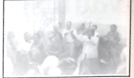
Brincadeiras próprias da 3ª idade.