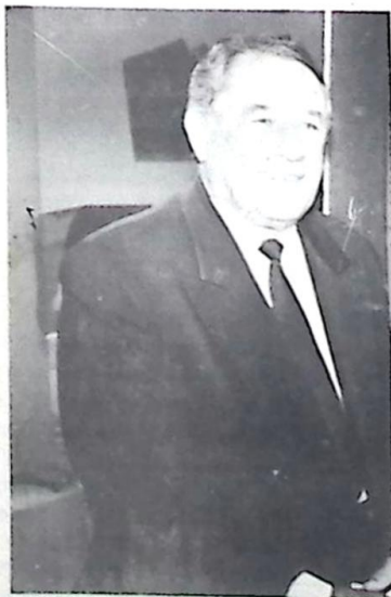
Senador Juvêncio César da Fonseca

O Senador eleito Juvêncio César da Fonseca disse esta semana que não pretende assumir nenhum tipo de postura política ou administrativa que represente discriminação ao Governo petista. "Fui eleito para representar o Estado e participar do seu desenvolvimento, independente da cor partidária da administração estadual" esclareceu Juvêncio aos jornalistas. "É claro que esta atitude de compromisso com o Estado e sua gente não significa apoio incondicional ao futuro governo, que merecerá de nossa gente um apoio sempre crítico, irrestrito naquelas questões que julgarmos do interesse da maioria da população", advertiu o Senador. Pág/03