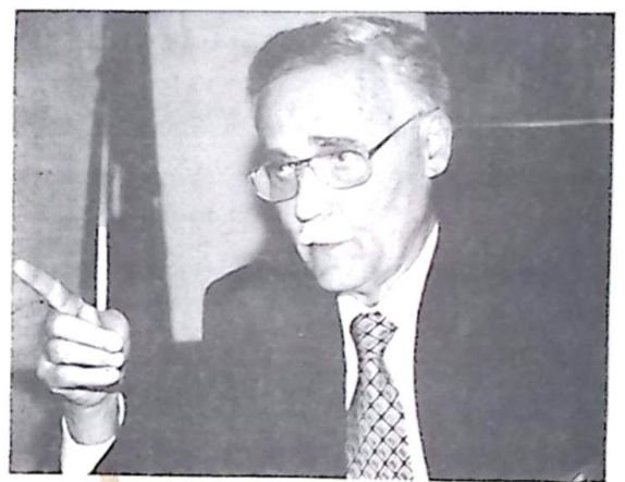
Governador Wilson Barbosa Martins

"A primeira conversa foi extremamente positiva e dentro da expectativa que eu tinha, pela história do Dr. Wilson e pelo compromisso dele como homem democrata, e que encerra sua vida pública dedicada ao Estado". Pág/03