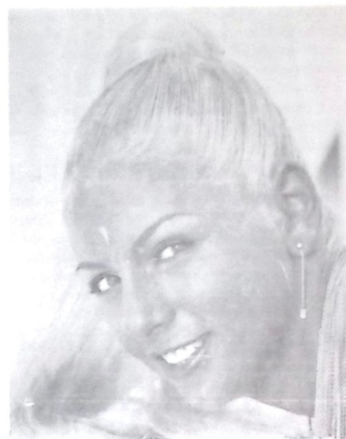
A mais bela loira, Carla Perez, rainha absoluta.