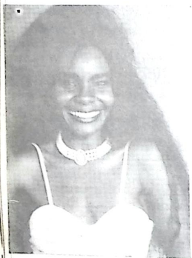
Dandara, Furacão da Bahia, iniciando carreira.