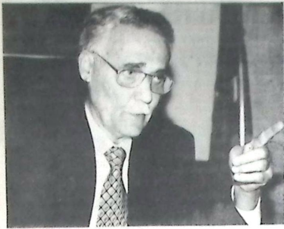
Governador Wilson Barbosa Martins

O Governador Wilson Martins manteve no último dia 26, à tarde, no seu escritório particular, o primeiro encontro com governador eleito pelo Partido dos Trabalhadores (PT), e Deputado Estadual José Orcirio Miranda dos Santos, o Zeca do PT. A conversa durou pouco mais de 20 minutos e foi