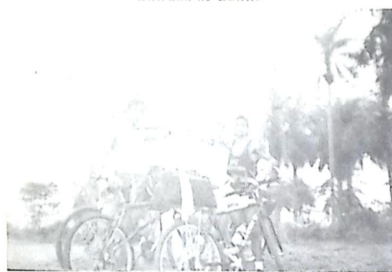
Lagoa Misteriosa - estrada de Porto Murtinho à Bonito