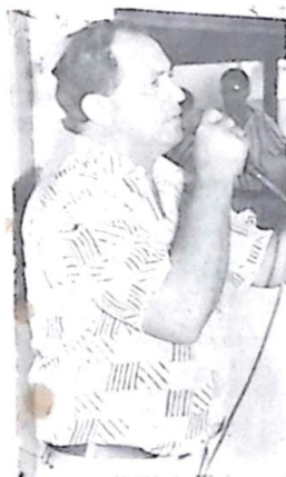
Deputado Zé Teixeira