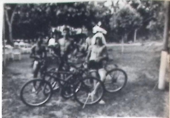
Balneário Municipal em Bonito/MS

O grupo garante que funciona e aconselha a quem quiser que o esporte vale mesmo.