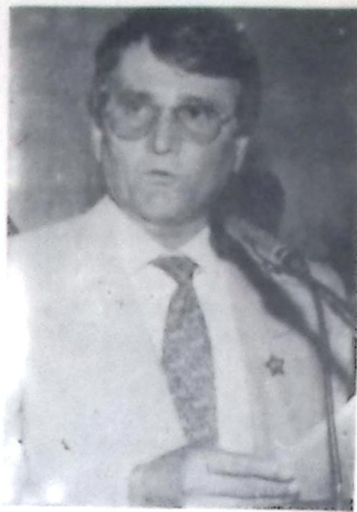
Governador eleito Zeca do PT

Depois tem audiência com o ministro do Meio Ambiente Gustavo Krause para tratar sobre as compensações econômicas pela inundação do lago da usina de Porto Primavera. Ainda tem compromisso agendado com a diretoria da Petrobrás,