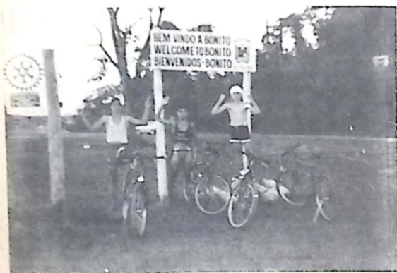
Entrada de Bonito

O ciclismo apesar de não ser um esporte muito incentivado em nossa cidade, tem fortes adeptos, são os integrantes do Grupo Pedalando.