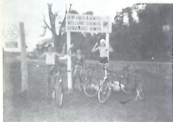
Entrada de Bonito