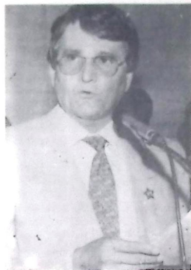
Governador eleito Zeca do PT

Fica apenas uma deixa, não apertem demais o homem, ele pode explodir, não confundam humildade, serenidade, com fraqueza, o passado é pródigo em lições. E não esquecer, também, dos votos dos pedrossianistas, sem eles Zeca não seria eleito.