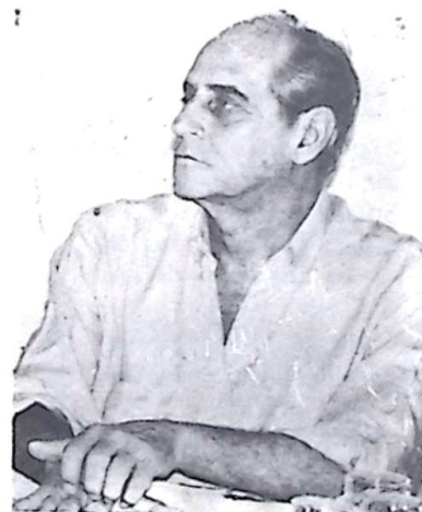
Senador Ramez Tebet

Para o relator, as críticas contra a decisão do Congresso de manter as emendas individuais - de R$ 1,5 milhão para cada um dos 594 parlamentares - devem partir de quem ignora a necessidade