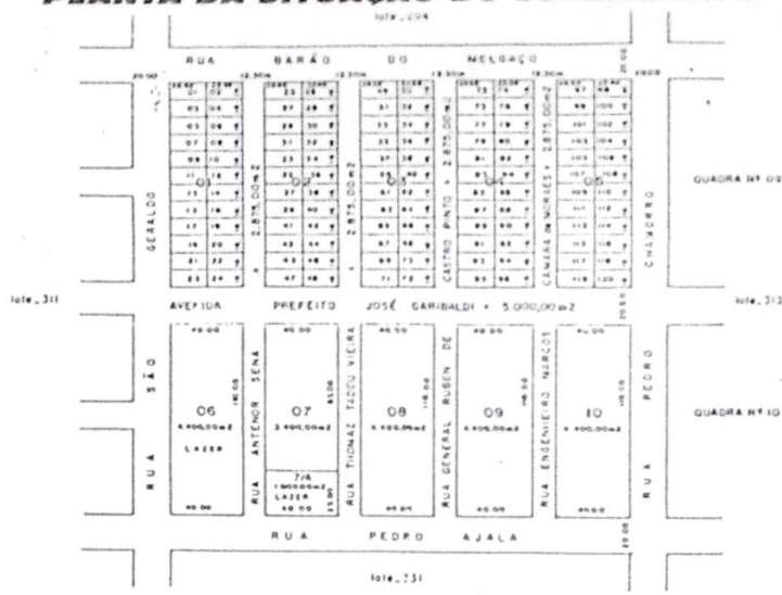
PLANTA DE SITUAÇÃO Escola - 1:2.000