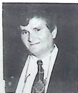
Zeca do PT Governador Eleito