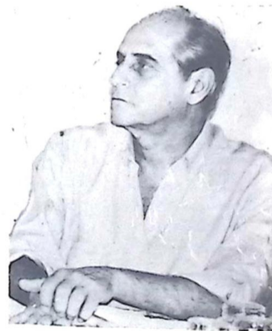
Senador Ramez Tebet

Na avaliação d' Secretário até o dia 15 o Estado deve efetuar o pagamento da maior parte da folha de outubro utilizando recursos próprios. Os recursos da Lei Kandir vão assegurar o