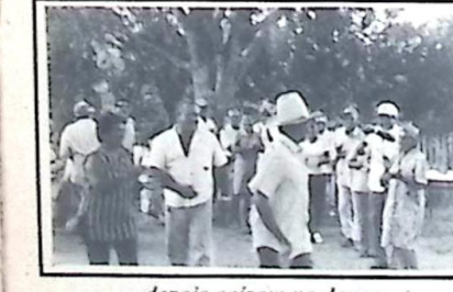
...depois caíram na dança...