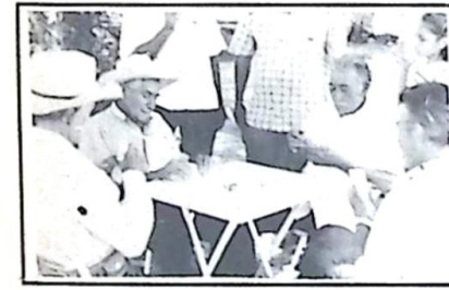
...Jogaram um sorteado...