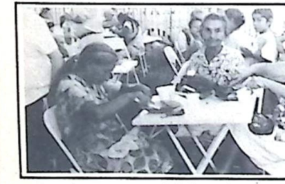
...saborearam um delicioso almoço...