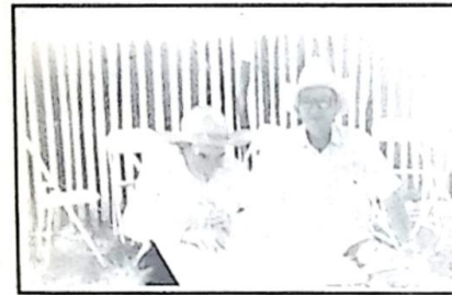
...Tomaram aquele tererê...