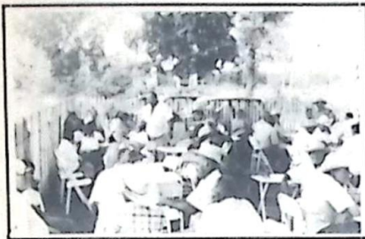
O aconchegante ambiente da Escola Municipal Maria do Carmo, foi palco desta festa, recebendo 75 idosos que debaixo de muita sombra...