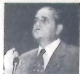
Senador Ramez Tebet, "agora poderá acontecer a retomada do desenvolvimento no País"

Carlos Patrocínio (PFL-TO) elogiou Tebet pela condução dos trabalhos na Comissão de Orçamento dizendo que eles "sinalizam para a correção de distorções regionais", e concordou com o Senador na avaliação de que a agricultura será o setor de ponta na retomada do desenvolvimento nacional. Ernandes Amorim (PPB-RO), por sua vez, lamentou a utilização de recursos orçamentários em "obras faraônicas" do Poder Judiciário, em detrimento da agricultura.