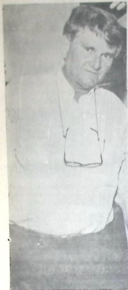
Governador Zeca do PT

A Superintendência de Obras e Habitação vai incentivar a formação e cooperativas no Interior, visando à obtenção de financiamentos para construção de moradias através de cartas de créditos da Caixa Econômica Federal.