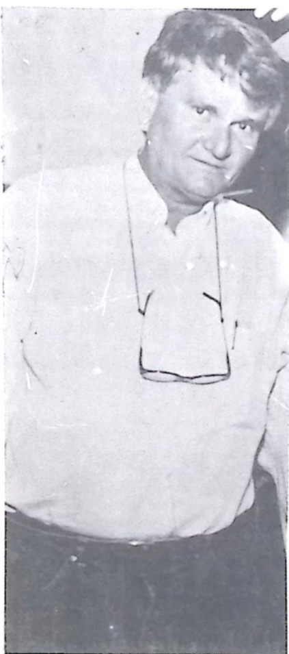
Zeca do PT - Governador de MS

O Governador determina a formação de uma Comissão, com entidades da sociedade civil, para analisar as concessões de regime especial e outra para estudar as acusações de nepotismo