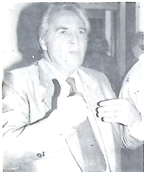
Deputado Londres Machado, reconduzido à Presidência da Assembléia Legislativa, pela quinta vez

Reconduzido nesta segunda-feira (1º de fevereiro) à presidência da Assembléia Legislativa pela quinta vez, o deputado Londres Machado (PSDB) ressaltou "a forma democrática como foi conduzido o processo eleitoral", ao mesmo tempo em que contestou a manifestação de alguns segmentos políticos, que classificaram com "continuismo" a sua eleição. "A decisão dos deputados é soberana e democrática", argumentou, ao comentar a sua recondução à presidência através do voto de 22 dos 24 parlamentares que compõem o Legislativo Estadual.