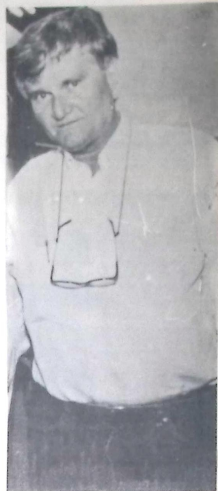
Governador do Estado Zeca do PT

Dourados - Teruel disse que já há empresas interessadas em construir termelétrica em Dourados, grande pólo econômico do Estado. O complexo poderia ser abastecido através de um ramal do gasoduto.