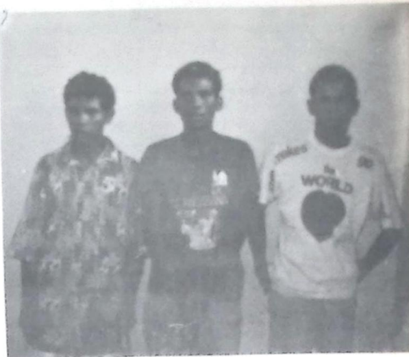
Na foto os três indivíduos autuados em flagrante pela Polícia

Janeiro, eles já foram presos, também pela Polícia Militar, depois de serem flagrados com 100 gramas da "marihuana" na própria residência. Segundo informações que recebemos minutos antes do fechamento dessa edição, tem mais gente na mira das autoridades policiais devido a prática de atividade ilícita com essa, ou seja, tráfico e porte de substância entorpecente. Te cuida malandragem antes que a "casa caia", depois não venham contar historinhas como a de que é apenas viciado, que comprou para experimentar, por curiosidade, etc e tal, porque não vai adiantar e o caminho será um só, os corredores da cadeia pública municipal.