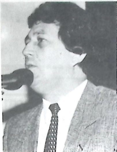
Deputado Waldemir Moka

Segundo Waldemir Moka, a recuperação do trecho é uma reivindicação dos produtores da região e das empresas de transporte de passageiros, segundo as quais "a má conservação das estradas vem aumentando os custos de manutenção da