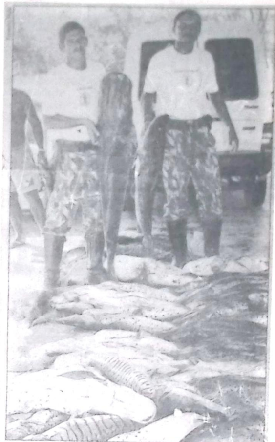
Policiais Florestais com parte do pescado apreendido

Os dois indivíduos presos foram entregues na Delegacia de Polícia Civil de Porto Murtinho, onde foram autuados em flagrante, porém, segundo as informações, eles devem pagar multa e responderem ao processo em liberdade. Todo o pescado apreendido foi distribuído para a população mais humilde de Porto Murtinho.