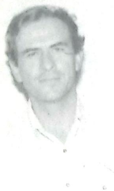
Prefeito Dácio Queiroz

O Prefeito Dácio Queiroz, de Antonio João, disse no último dia 25 que espera do Governo do Estado a manutenção de um canal de diálogo sobre as questões do Município, para que novas obras sejam viabilizadas em sua cidade, beneficiando a população. Dácio Queiroz se reuniu com os Vereadores, diretores de departamentos, lideranças sindicais e políticas do Município na sede da Coordenadoria Geral de Ação Social para debater novos programas sociais. Pág/09