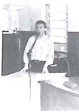
Vereador Renato de Souza Rosa - Presidente da Câmara

O Vereador salientou que a cota estabelecida atualmente é muito pequena em relação às dimensões territoriais de Bela Vista, que possui vários bairros e distritos afastados e pelo menos três assentamentos de trabalhadores rurais.