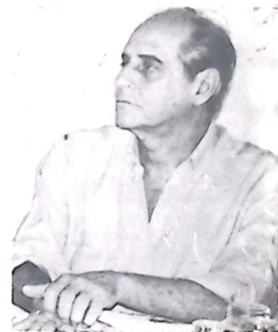
Senador Ramez Tebet

No encontro ficou acertado que a bancada se reunirá regular e periodicamente com vistas a estabelecer uma agenda comum, de modo a evitar desperdício e superposição nas ações desenvolvidas pelos representantes sul-matogrossenses e procurando somar as iniciativas para assegurar resultados concretos em termos de benefícios, obras e recursos para o Estado.