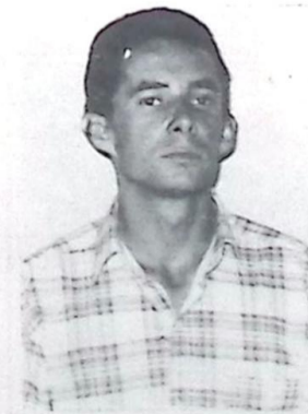
Dilmir da Silva Leite Prefeito de Caracol