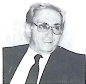
Deputado Roberto Orro

Segundo o parlamentar, "o atraso no pagamento dos funcionários públicos do Estado devido as dificuldades na definição de um cronograma para a regularização dessa situação por parte do Executivo Estadual, tem levado inúmeros servidores à exaustão na busca de uma solução para saldar o acúmulo de débitos, principalmente com órgãos vinculados ao Governador de Mato Grosso do Sul".