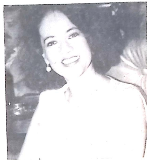
Deputada Celina Jallad irá presidir a sessão em homenagem ao Dia da Mulher

A Primeira Dama de Campo Grande, Elizabeth Puccinelli, estará representando as demais de todo o Estado. As mulheres índia e negra também serão reverenciadas na oportunidade, de acordo com a programação.