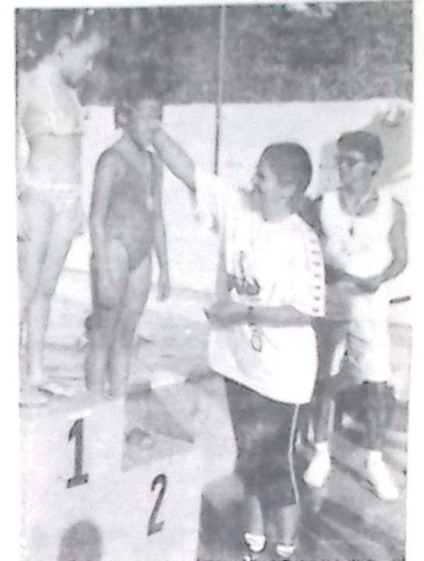
Mães de alunos participam da confraternização e entrega de medalhas aos filhos