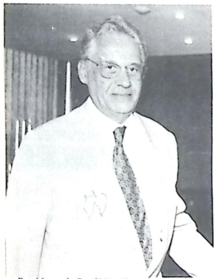
Presidente da República Fernando Henrique

O pacote linha-dura do governo vai provocar mais desemprego e recessão para evitar o pior dos males: a inflação