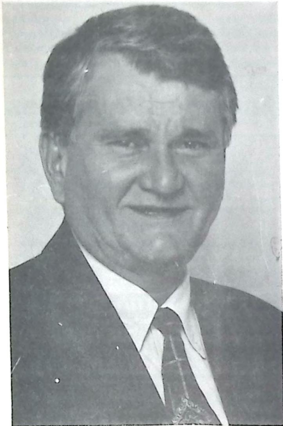
Governador Zeca do PT

Um clima de cordialidade e cooperação marcou a primeira reunião oficial do Governador de Mato Grosso do Sul, Zeca do PT, com a bancada federal sul-matogrossense no Congresso Nacional. O encontro aconteceu dia 11 no apartamento do Senador Ramez Tebet (PMDB), em Brasília, escolhido, dias atrás, como o primeiro coordenador do grupo de parlamentares nesta nova forma de atuação política conjunta e cooperativa em favor do Estado. Abrindo a reunião, Ramez fez um relato ao Governador da primeira audiência em conjunto da bancada com o Ministro Clóvis Carvalho, Chefe da Casa Civil da Presidência da República, quando se tratou da manutenção dos órgãos federais no Estado. Em seguida, falou a Deputada Federal Marisa Serrano (PSDB), defendendo a necessidade de uma ação política da bancada com vistas à batalha por mais recursos para a área social.