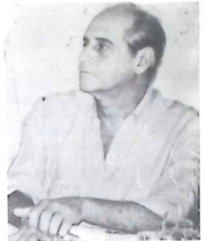
Senador Ramez Tebet

Brasília - O Senador Ramez Tebet (PMDB-MS) defendeu maior ênfase à produção agropecuária como a maneira certa para o Brasil sair da crise. "O governo precisa abandonar a ótica monetarista e concentrar esforços na vocação agrícola do país. Estamos patinando na faixa de 70 a 80 milhões de toneladas anuais de grãos, há mais de uma década, mas podemos chegar a 240 milhões de toneladas por ano, em pouco tempo, se houver melhor gerenciamento dos recursos governamentais", garantiu.