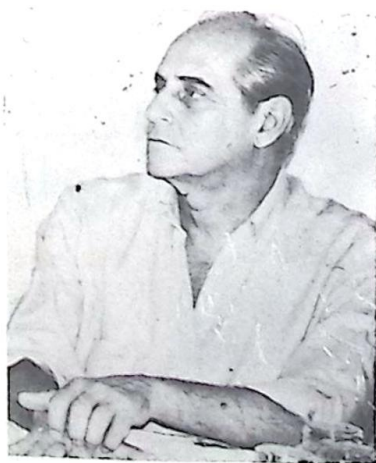
Senador Ramez Tebet

"O governo precisa abandonar a ótica monetarista e concentrar esforços na vocação agrícola do País. Estamos patinando na faixa de 70 a 80 milhões de toneladas anuais de grãos, há mais de uma década, mas podemos chegar a 240 milhões de toneladas por ano, em pouco tempo, se houver melhor gerenciamento dos recursos governamentais", garantiu. Página-05