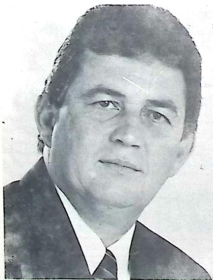
Vice-Líder da Câmara dos Deputados - Waldemir Moka

Medida do Ministério da Agricultura começaria a valer a partir de abril e atingiria o transporte de bois e carne de MS para o resto do País