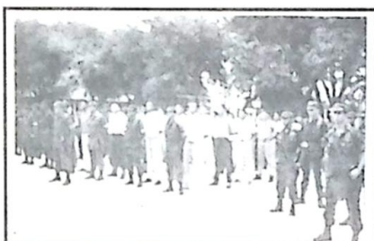
Os novos conscritos se perfilam às autoridades presentes

No último dia 08 de Março, aconteceu na 2ª Cia Fron a incorporação do efetivo variável do ano de 1999 partici-