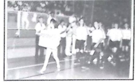
4º lugar Paranhos não foi classificada