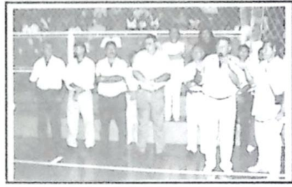
Garibaldi dá as boas vindas aos atletas que estão participando da Copa Morena em Bela Vista