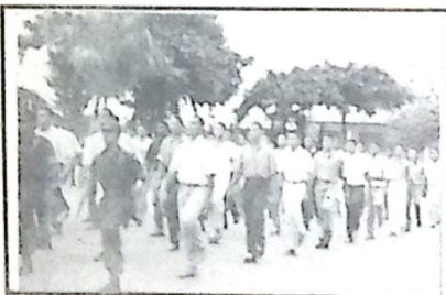
Os novos conscritos adentram no pátio da 2ª Cia Fron