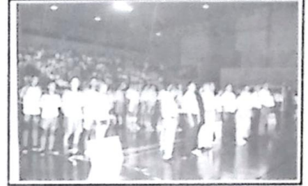
Autoridades e as equipes cantando o Hino Nacional

condições para que Bela Vista, participe adequadamente dos esportes. Hoje temos um dos melhores e mais bonitos Ginásio de Esportes do nosso Estado e através dessas