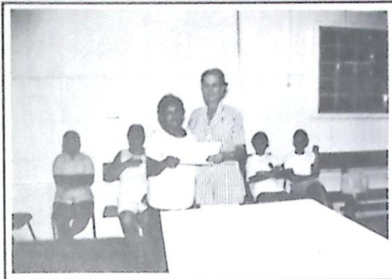
As alunas do Curso de Corte e