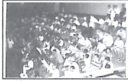
É o grande o público belavistense que foi prestigiar o evento esportivo