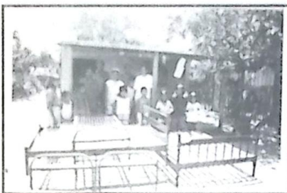
Os beneficiados ficaram felizes pelo recebimento das camas e dos colchões

Solidariedade com pessoas menos favorecidas é que não falta aos militares da Companhia de Fronteira. Na semana passada, através da seção de Relações Públicas doaram camas e colchões à família carente da cidade, foram entregues os itens abaixo relacionados: 02 camas, 04 colchões e 01 cesta básica, muitos podem achar pouco, mas se todos os brasileiros que pudessem o fizessem, com certeza dariamos um passo muito importante para extinguir a miséria no Brasil.