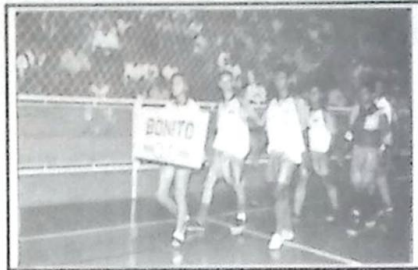
2º lugar equipe de Bonito

"Bela Vista, está hoje preparada para receber qualquer tipo de esporte neste recinto, visto que reformamos toda a quadra de esportes, dando-lhe um novo visual e