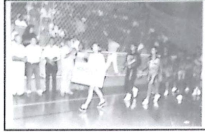
3º lugar equipe de Miranda