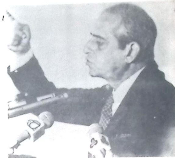
Senador Ramez Tebet

É fato notório que muitos trabalhadores que estudam em escolas de ensino médio e faculdades particulares, pelas suas condições sociais, são obrigados a atrasar os pagamentos das parcelas da anuidade. O fato causa, por um lado, um índice de inadimplência gigantesco e, por outro, quando o trabalhador consegue manter em dia os pagamentos ou