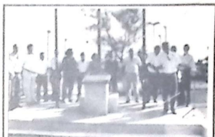
Hasteamento dos Pavilhões