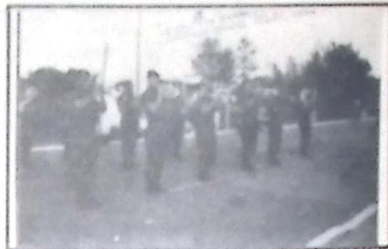
Alvorada festiva realizada pela Banda do 10º RC Mec de Bela Vista