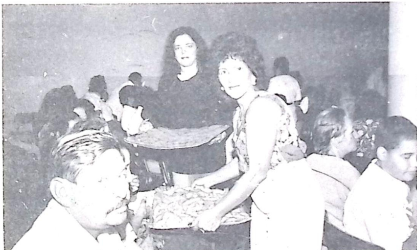
Registro da festa em homenagem ao Dia das Mães em Antonio João