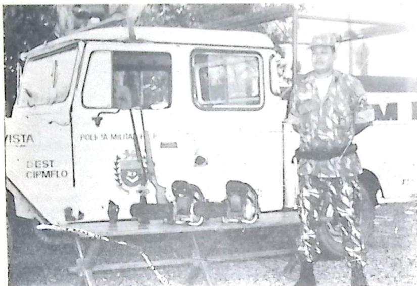
As duas Moto-Serras, 02 rifles e 01 revólver apreendidos pela Florestal em poder dos Assentados

Em operação de fiscalização realizada dia 11 pp., terça-feira, no Assentamento Caracol, uma guarnição do Destacamento PM Florestal de Bela Vista, comandada pelo Sub-Tenente Souza, efetuou a detenção de cinco assentados pelos crimes de extração ilegal de madeira em área de reserva legal, destruição da floresta nativa, porte e uso de moto-serras sem registro e porte ilegal de armas de fogo. Foram apreendidos 2 moto-serras, 2 rifles calibre 22, 01 revólver calibre 22 e aproximadamente 665 lascas de aroeira (postes).