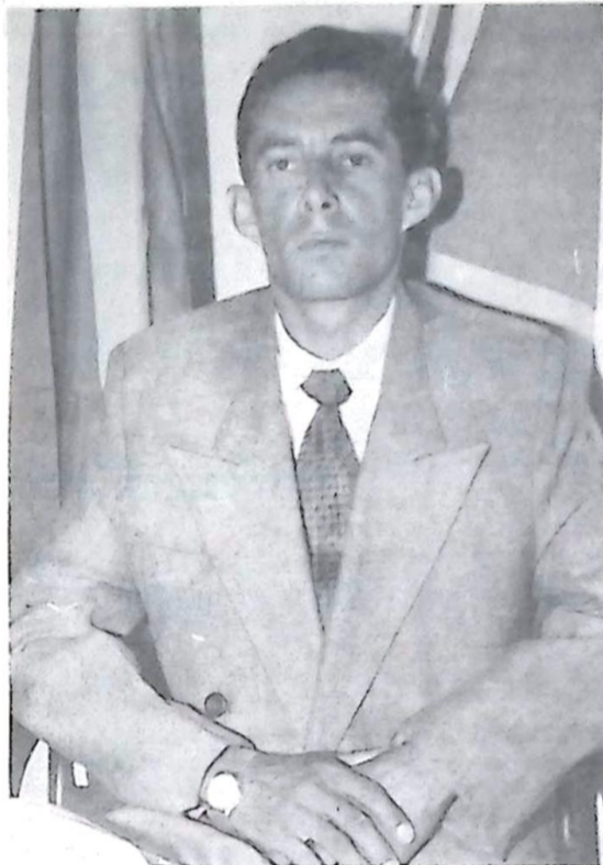
Prefeito de Caracol, Dilmar da Silva Leite