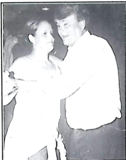
Presença marcante do Governador Zeca do PT, aqui ele dança com sua filha