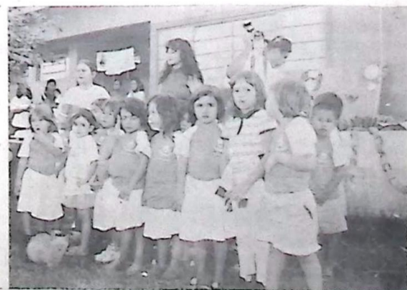
Flagrante das crianças na Creche Municipal - Página-03

O diretor-geral da Agência Nacional de Petróleo - ANP, David Zilberstajn, genro do Presidente da República, por ele nomeado para a autarquia, anunciou no dia 02/07/98, cortes nas áreas solicitadas pela Petrobrás para dar continuidade às operações de exploração, desenvolvimento da produção e exploração de petróleo. Página-03