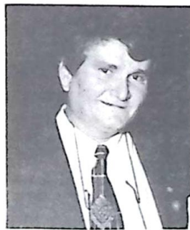
Zeca do PT Governador do Estado

Os produtores, segundo Teixeira, foram levar ao governador sua apreensão diante da intranquilidade no campo. "Duas preocupações centrais justificam essa mobilização: a invasão abusiva e desordenada de propriedades produtivas e a falta de estrutura da segurança pública para cumprir as ordenas judiciais de reintegração de posse". Teixeira disse que há casos de fazen-