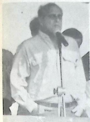
Senador Ramez Tebet