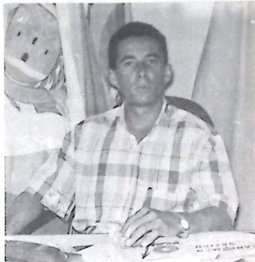
Prefeito Dilmar da Silva Leite

patrolamento, que a médio prazo deverá beneficiar todas as estradas vicinais do município. Nunca é demais lembrar que no início de sua administração, o Prefeito Municipal Dilmar Leite encontrou o maquinário desta importante secretaria, todo sucateado, em cima de tocos e promoveu sua completa recuperação.