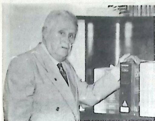
Deputado Federal Nelson Trad

Desde o primeiro mandato do presidente Fernando Henrique Cardoso que o deputado federal por Mato Grosso do Sul, Nelson Trad, do PTB, vem alertando o governo para a necessidade da criação de um programa capaz de com-