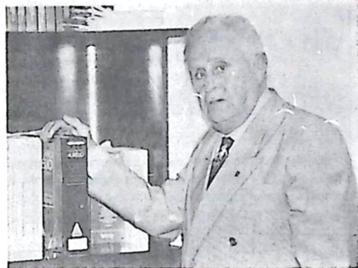
Deputado Nelson Trad

Desde o primeiro mandato do presidente Fernando Henrique Cardoso que o deputado federal por Mato Grosso do Sul, Nelson Trad, do PTB, vem alertando o governo para a necessidade da criação de um programa capaz de combater o desemprego e assim resgatar a dignidade das pessoas que estão vivendo em situação degradante. Página - 03