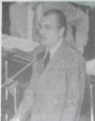
Sarney pediu que governo crie logo o fórum permanente das microempresas

Conforme Sarney, sua iniciativa não consistiu num gesto isolado, mas traduzia uma visão que resume toda sua carreira política, sempre preocupada com o problema social. "Eu tenho sido um grande crítico da Constituição em vigor, mas no que se refere ao social reconheço que ela tem grandes e necessários avanços", observou o ex-presidente.