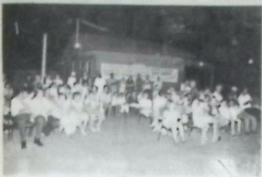
Todos os moradores da Vila Arabela Freire, ouvindo as propostas do prefeito municipal Dácio Queiroz Silva