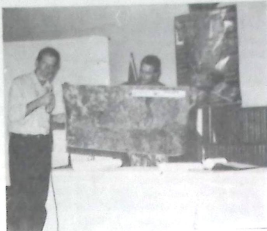
Secretário de Estado de Meio Ambiente, Egon Krackekke, que também participou do Encontro de Integração em Bela Vista

Enfatizando a execução de uma relação eficaz com o Brasil, o ministro do Interior do Paraguai, Walter Bower Montalto (foto), chamou a atenção dos participantes para importância que Mato Grosso do Sul tem na rota de integração bioceânica, que liga os oceanos Atlântico e Pacífico. "O Estado tem uma localização estratégica", analisou Montalto.