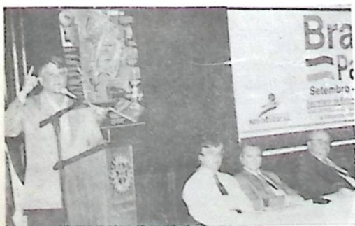
Em seu pronunciamento na abertura do Encontro de Integração Brasil/Paraguai em Bela Vista, o