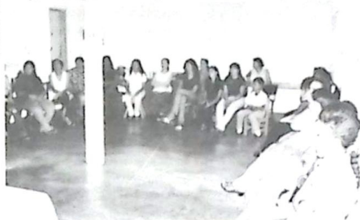
Mais de trinta alunas concluíram o Curso de Manicure e Pedicure oferecido pela Sec. de Promoção Social

mentar a renda de várias famílias", salientou. Muitas das alunas presentes já estavam fazendo o seu terceiro curso, de-