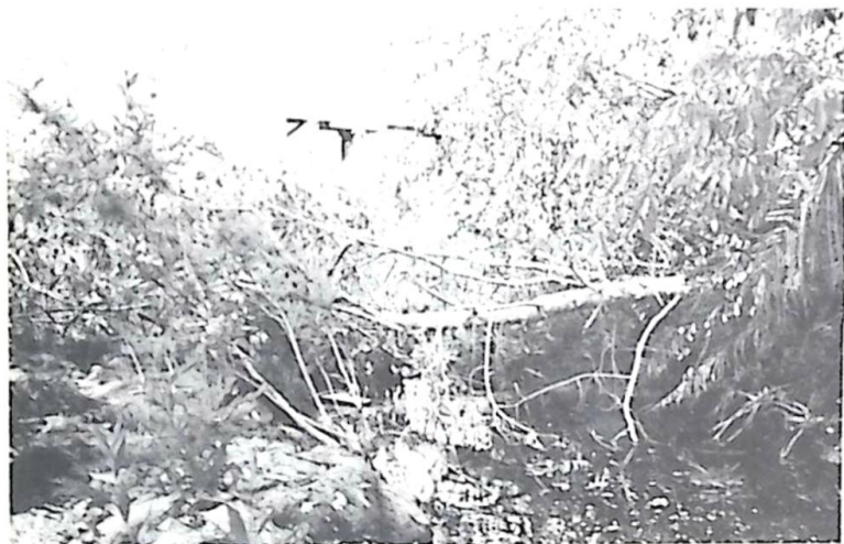
Árvores foram cortadas e deixadas sobre o leito do Córrego Azul, um verdadeiro crime ambiental