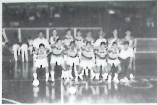
Corte Aço, Campeão da Copa Morena Juvenil de Fut-Sal

A equipe de Bela Vista, Vice-Campeã da Copa