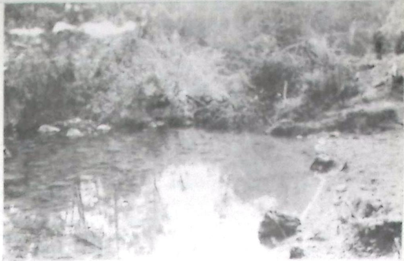
Vista do Córrego Azul totalmente entulhado por árvores derrubadas às suas margens

O Vereador entende que as providências precisam ser exemplares, para que outras depredações como essa, contra o patrimônio alheio, como ocorreu no Córrego Azul, praticamente acabando com