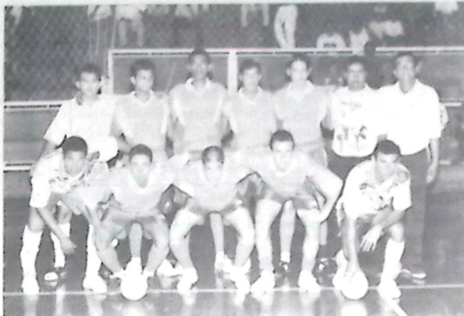
Seleção de FutSal Juvenil de Bela Vista, Vice-Campeã da Copa Morena

Nos últimos dias 9, 10 e 11 Bela Vista sediou a fase final da Copa Morena de Fut-Sal Juvenil, a mais importante competição da modalidade em nosso Estado para atletas nascidos a partir de 1981, ou seja, até 18 anos. Os jogos foram disputados no Ginásio Municipal de Esportes e contou com a participação das equipes de Ladário, Corte Aço (Dourados), Rio Verde, Rio Negro, Comercial Oshiro (Dourados) e Bela Vista, que entrou na etapa final por ser o município sede. Página-08