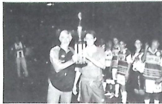
O Capitão da Seleção de Bela Vista recebe o troféu de Vice-Campeão