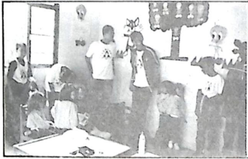
Alunos da AUE visitando as Creches