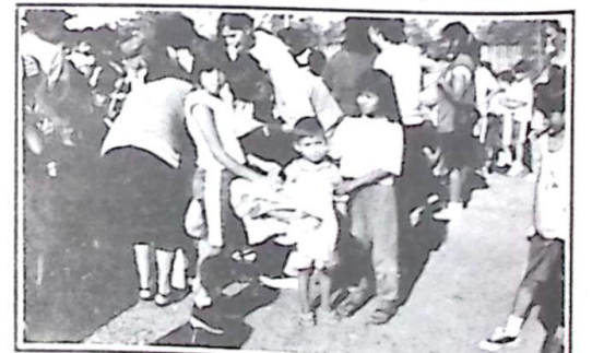
Alunos fazendo a entrega de brinquedos

A Escola Municipal Nossa Senhora do Perpétuo Socorro realizou entre os dias 13/09 à 09/10 a "Campanha do Dia da Criança", com o intuito de angariar doações de brinquedos. Durante a campanha houve uma grande mobilização da Comunidade Escolar, que ao final conseguiu arrecadar aproximadamente 4000 brinquedos, os quais foram submetidos a oficina para serem empacotados.