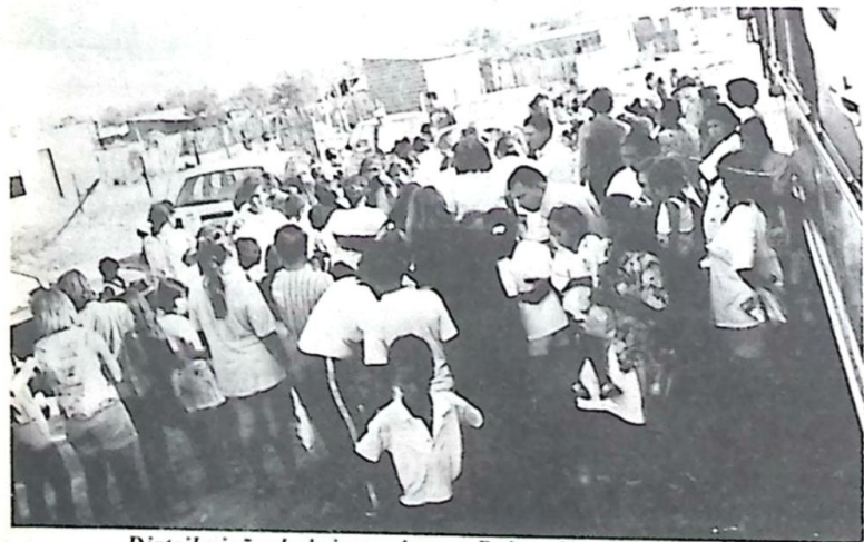
Distribuição de brinquedos no Bairro Nova Esperança

A Escola Municipal Nossa Senhora Perpétuo Socorro realizou entre os dias 13-09 à 09/10 a "Campanha do Dia da Criança", com o intuito de angariar doações de brinquedos. Página-04