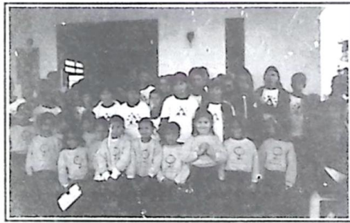
Alunos da FUNLEC com crianças da Creche