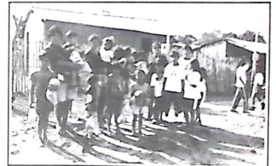
Alunos e moradores do Bairro Nova Esperança