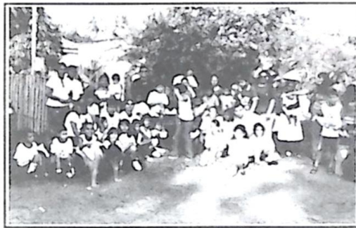
Alunos e professores com moradores do Bairro Clarão da Lua