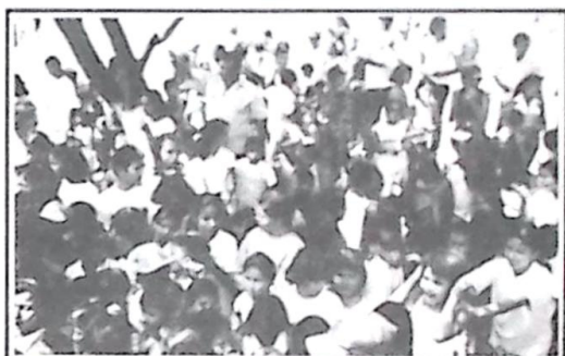
Centenas de crianças participaram da festa