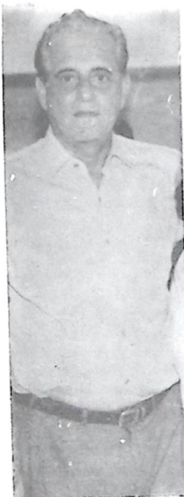
Senador Ramez Tebet

Antonio Carlos comentou a falta de controle interno sobre a conduta dos integrantes do Judiciário, apontada no relatório de Paulo Souto. Ele sugeriu modificações na legislação para que os juizes possam agir mais