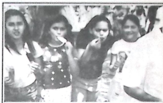
Além do cachorro quente e refrigerante a garotada saboreou muito picolé

Parabenizamos os organizadores de todas as festas em homenagem ao Dia da Criança em nossa cidade e na próxima edição cobertura com fotos da festa realizada no salão paroquial.