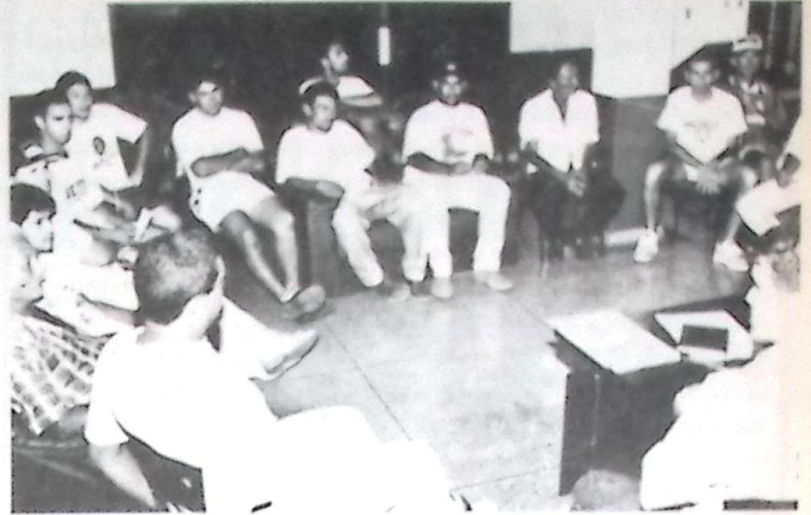
O congresso técnico na Secretaria Municipal de Educação definiu a formação dos grupos e a ordem da realização dos jogos

Em mais uma realização do Conselho Municipal de Desportos - CMD - em conjunto com o SINDIÁRBITROS de Bela Vista, contando com total apoio do Prefeito José Garibaldi e da Secretaria Municipal de Educação, terá início neste sábado, dia 23, no Estádio Municipal Otávio Fontoura, a TAÇA CIDADE DE BELA VISTA, envolvendo quase 20 equipes de futebol nas categorias Livre e Veteranos.