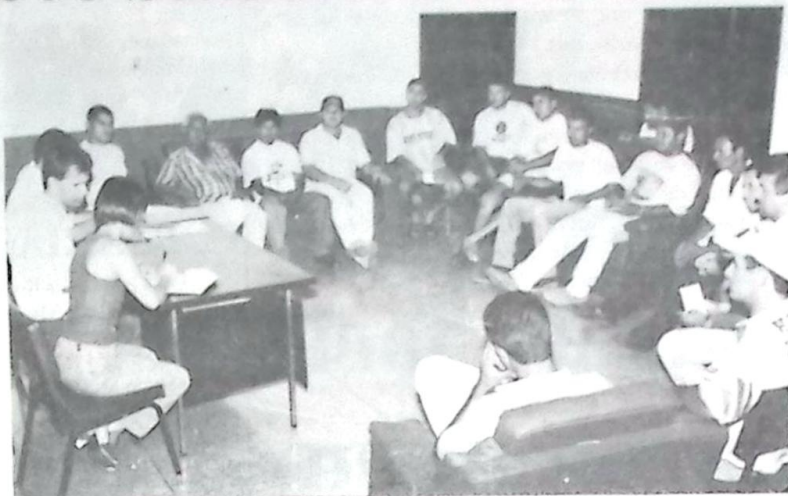
Registro do Congresso Técnico que definiu a forma de disputa da Taça Cidade de Bela Vista