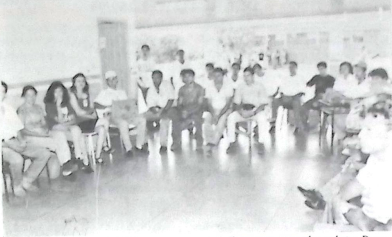
Parte dos novos Agentes da FNS, que começam a trabalhar no programa de combate a Dengue