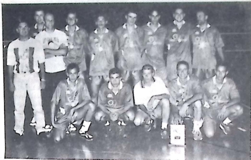
Seleção Belavistense de Voleibol, que ganhou o direito de representar o Estado nos JAB