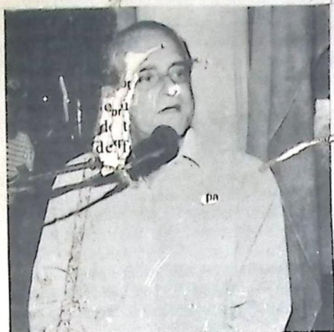
Senador Ramez Tebet

O Senador Ramez Tebet (PMDB-MS) elogiou o governo pela edição, no último dia 13, da Medida Provisória 1.988, que facilitou a concessão de empréstimos com recursos dos fundos constitucionais de financiamento do Norte, do Nordeste e do Centro-Oeste. Na opinião do senador, o estabelecimento de taxas de juros fixas - entre 9% e 16% ao ano - dará segurança aos produtores e empresários para investir nessas regiões. - Valeu a pena travarmos o bom combate - disse Tebet, lembrando a luta dos parlamentares das bancadas do Norte, Nordeste e Centro-Oeste para flexibilizar as regras dos fundos constitucionais. O senador explicou