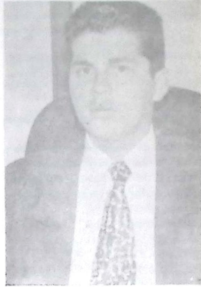
Deputado Waldir Neves

"Numa época de crise e desemprego, é fundamental preservar o interesse dos assalariados e das famílias de baixa renda, que geralmente não podem pagar taxas proibitivas", afirmou. O deputado defende a manutenção da tarifa social para os servidores de primeira necessidade, como o abastecimento de água, energia elétrica e emissão de documentos. (Assessoria de Imprensa Parlamentar)