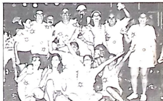
Bloco Milenium 2000. Troféu participação