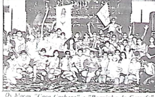
Os blocos "Caça Cachaça" e "Boquinha da Garrafa", que animaram as cinco noites do Carnaval no Grêmio