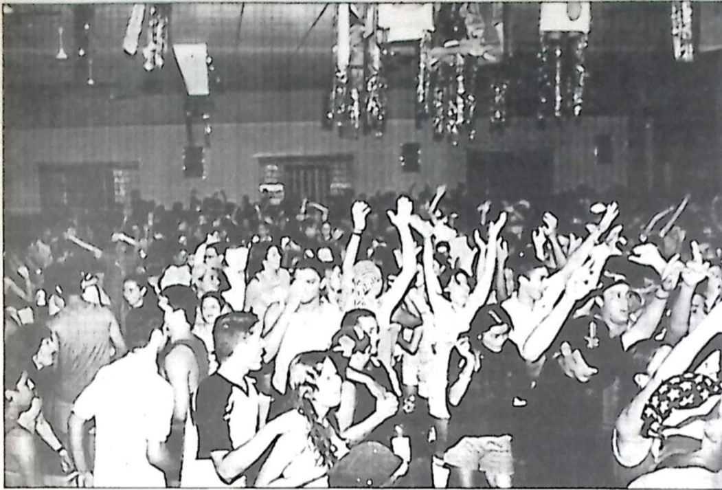
Os destaques e alguns flagrantes do Carnaval no Clube, na Página-12