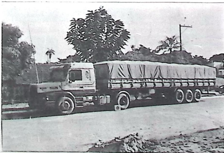
A Carreta Scania recuperada pela PM de Bela Vista

Demonstrando mais uma vez o excelente preparo e apurado tirocínio dos policiais integrantes do 3º Pelotão PM, no último domingo, dia 09, na rodovia MS 384, que liga Bela Vista a Antonio João, a guarnição de serviço daquela unidade policial recuperou uma carreta Scania, produto de roubo no Estado do Paraná e efetuou a prisão do seu condutor. Segundo as informações, por volta das 09:00 horas a central de rádio da Polícia Militar recebeu informação através de telefonema anônimo de que uma carreta Scania de cor azul se encontrava nas proximidades do Auto Posto Turbo e seu condutor aparentemente se encontrava perdido. Pág/07