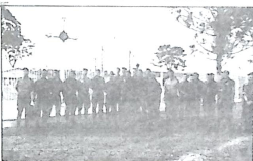
Turma do 2º ano da ECEME

A visita ocorreu no dia 26 de outubro pela manhã. Quando por lá chegaram, foram calorosamente recebidos pelo Comandante do Regimento Antônio João e assessores. Foi-lhes ministrada uma palestra sobre a Guerra da Triplice Aliança e narrados os feitos heróicos do Ten. Antônio João.