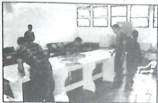
Equipe do RAJ no 20º RCB (início dos jogos)

O 10º R C Mec, integrando o conjunto das organizações Militares Operacionais da "Brigada Guaicurus"; fez-se representar em Campo Grande/MS, no período de 30 de outubro 2000 a 03 de Nov 2000, nos jogos de Guerra do corrente ano.