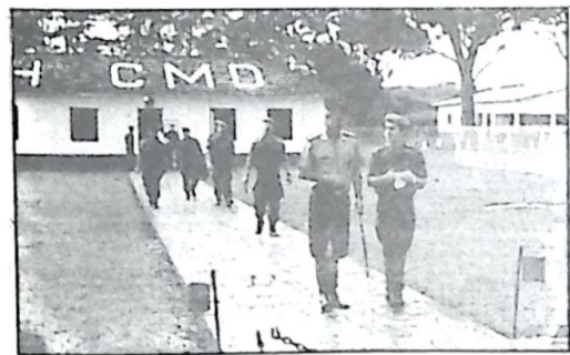
Recepção aos alunos

Como parte do cronograma anual de instruções da ECEME, estiveram em visita ao PHCMD, os alunos do 2º ano dessa tradicional Escola de Altos Estudos Militares