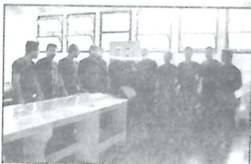
Equipe do RAJ no 20º RCB (encerramento dos Jogos)