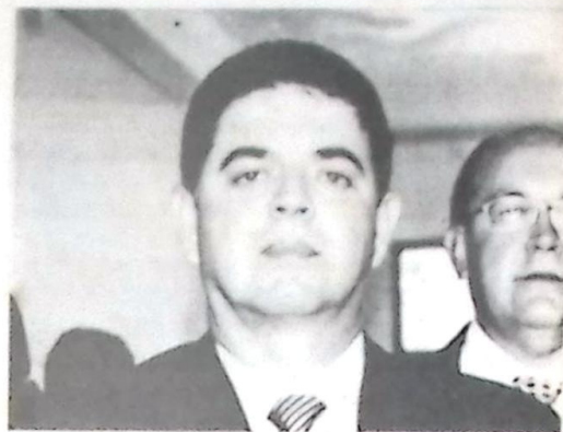
Prefeito Márcio Monteiro revoga Lei de taxa de iluminação.

vencimento para o dia 31 de março, os moradores ainda vão mexer no orçamento, para contribuir com o tarifa. Até o início da semana (20.03), a Enersul ainda não tinha recebido nenhum comunicado oficial para o cancelamento da cobrança da tarifa.