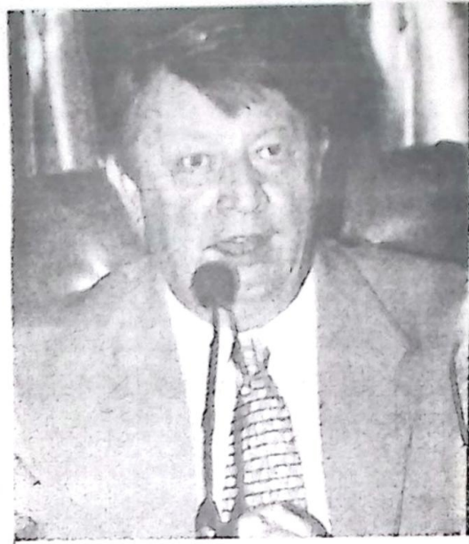
Dep. Ary Rigo

O Presidente da Assembléia Legislativa, deputado Ary Rigo, pediu aos membros da Comissão de Agricultura, Pecuária e Desenvolvimento Agrário, que tem como Presidente o deputado Zé Teixeira e da Comissão de Meio ambiente e Desenvolvimento Sustentável, presidida pelo deputado Paulo Correa, que participassem junto com os produtores pantaneiros da ilha do Nabileque das discussões que envolvem a possível criação do Parque do Nabileque pelo Governo Estadual. Pág. 2