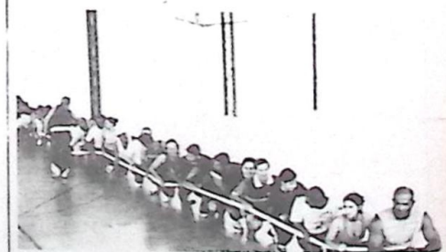
Flagrantes dos Atletas, no momento da realização do Curso.

LEIA E ASSINE TRIBUNA DA FRONTEIRA 439-1544