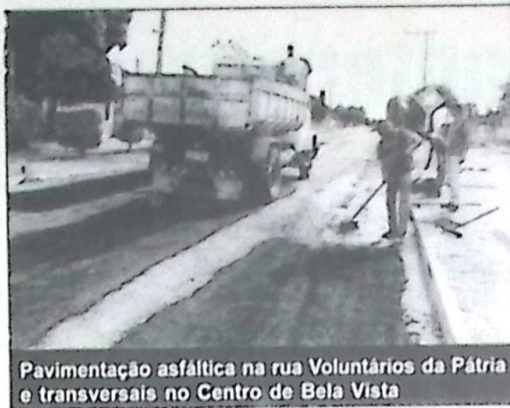
Pavimentação asfáltica na rua Voluntários da Pátria e transversais no Centro de Bela Vista

A prefeitura de Bela Vista recebeu R$ 2.160.249,25 e teve uma CONTRA PARTIDA no valor de R$ 232.644,16 (Duzentos e trinta e dois mil seiscentos e quarenta e quatro reais e dezesseis centavos). Para o prefeito Dr. Geraldo Pinheiro Murano (PDT) "estamos prestando contas da nossa administração a população de nossa terra".