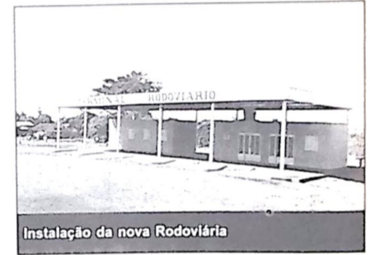
Instalação da nova Rodoviária