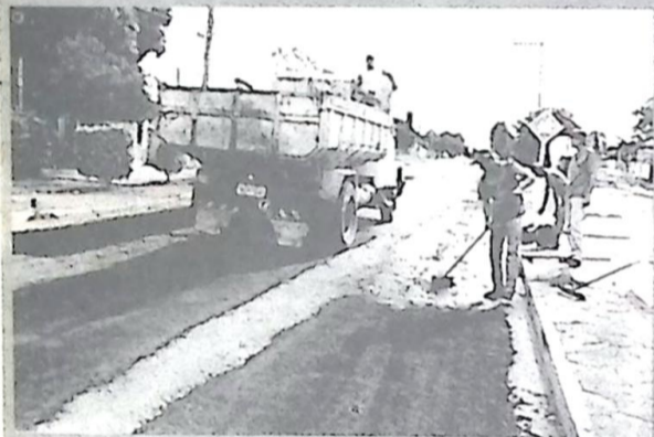
Pavimentação asfáltica na rua Voluntários da Pátria e transversais no Centro de Bela Vista