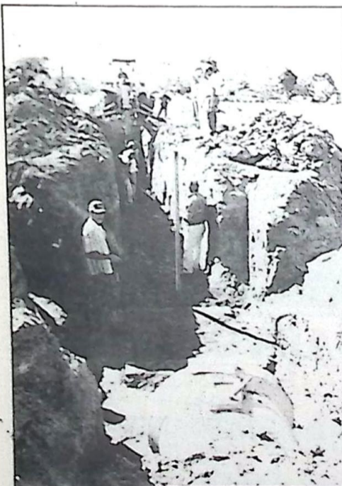
Execução de Sistema de esgotos sanitários em parceria com a FUNASA as margens do Rio Apa e bairro Espírito Santo