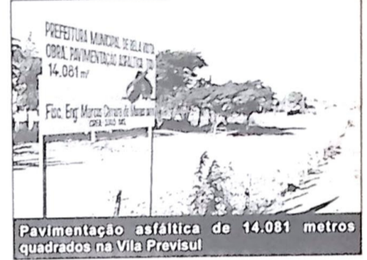
Pavimentação asfáltica de 14.081 metros quadrados na Vila Previsul