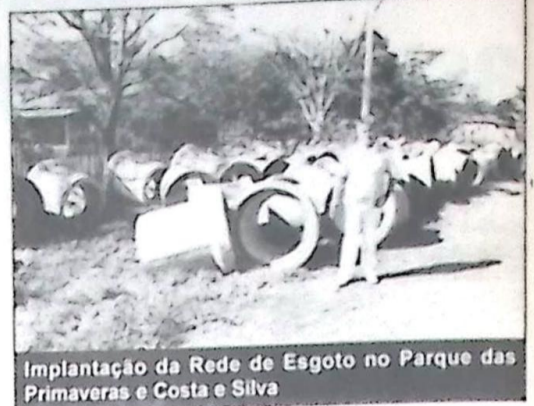
Implantação da Rede de Esgoto no Parque das Primaveras e Costa e Silva