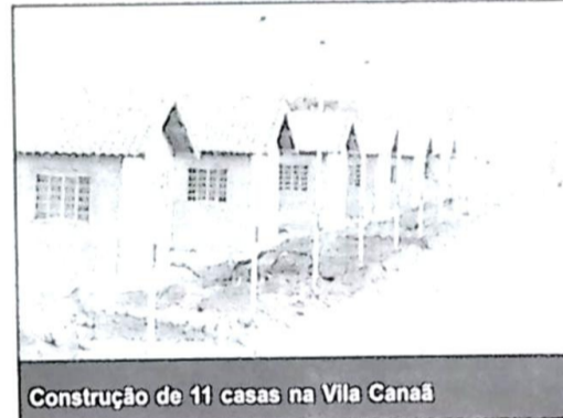
Construção de 11 casas na Vila Canaã