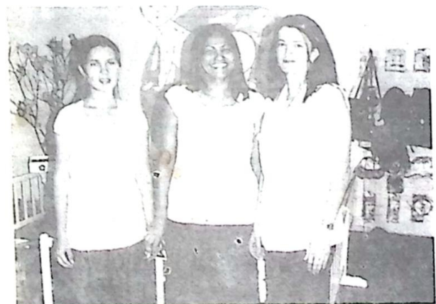
Celenir - Nita e amiga