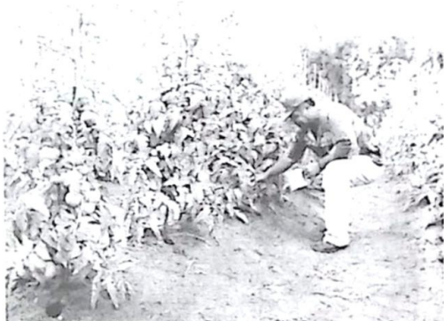
Lavoura-vitrine de tomate é uma das atrações da feira agroindustrial de Antônio João