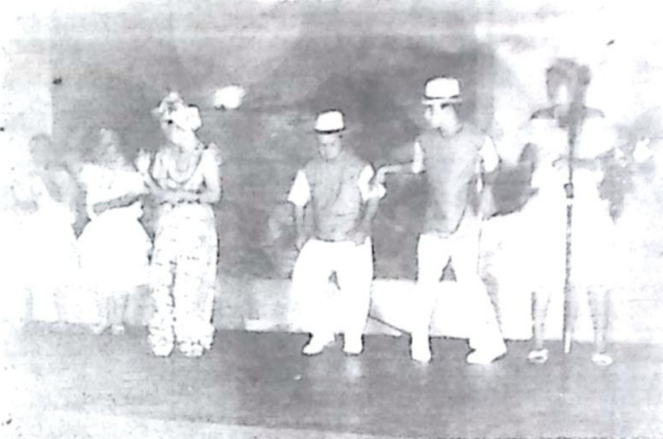
Flash da Noite Cultural

A direção da escola agradece a todas as pessoas que marcaram presença na maravilhosa tarde cultural.