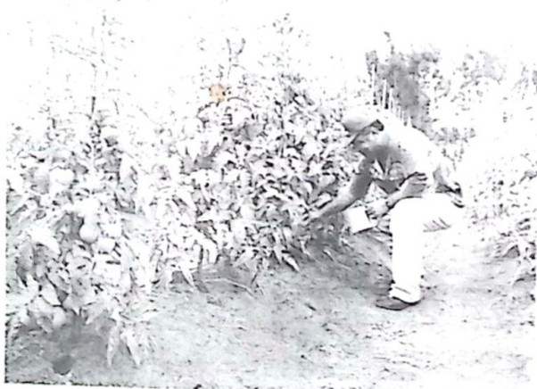
Lavoura-vitrine de tomate é uma das atrações da feira agroindustrial de Antônio João