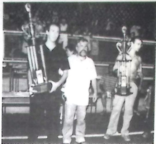
Murano entrega prêmios nos Jogos da REME e Bela Vista Olímpica

A escola São Clemente do Distrito Nossa Senhora de Fátima (Cativi) vice-campeã somou 27 pontos com o 1º lugar no futsal feminino, 2º lugar no atletismo feminino.