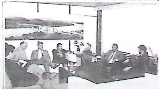
Governador Zeca do PT, parceiros para viabilizar projetos de implantação da Vibrapar no Estado. Inarid Vogl

O governador designou o secretário de Produção e Turismo, José Felício e o secretário de Meio Ambiente, Márcio Portocarrero para ana-