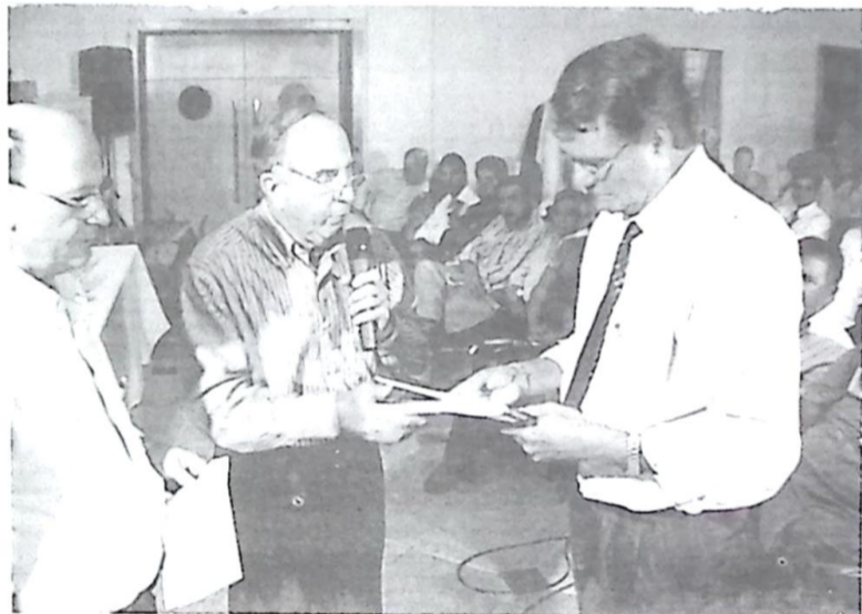
Vice-prefeito explanou ao governador a situação atual do setor

O vice-prefeito fez uma explanação da situação atual do setor, apontando os pontos fracos e sugerindo medidas que podem ser adotadas pelo governo do Estado para solucionar esses problemas. Nos últimos dez anos, a frota foi reduzida de 566 para 463 ônibus, a taxa de ocupação caiu de 44,57% para 36,84%, bem como o número de via-