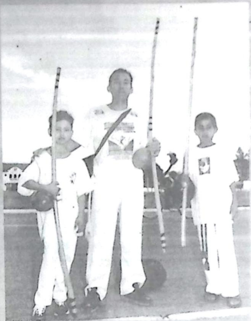
famílias esses projetos so formação dos nossos jovens. vem a somar, pois ajudam na (AIPM)

Para os moradores da Vila Canaã que conta com aproximadamente 150