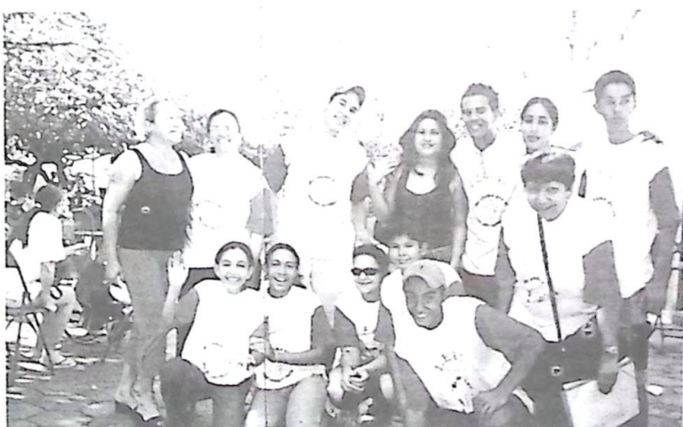
O 1º ano do ensino médio ganhou o 2º lugar da gincana do IEBV 2002 - Alunos professores e Mães