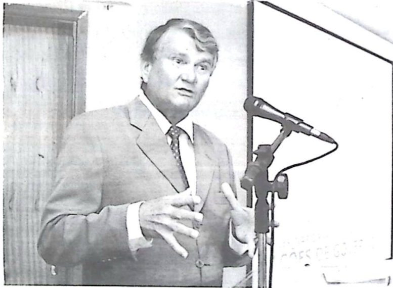
Zeca: projetos se materializarão na medida do empenho de cada servidor

Os 35 projetos prioritários do Governo Popular para os próximos quatro anos só sairão do papel para serem efetivamente concretizados com o empenho de segundo e terceiro escalões da administração, que são quem gerencia e executa todas as ações. A afirmação é do governador Zeca do PT, feita hoje pela manhã, no auditório do Unifisco, durante a abertura da reunião em que estavam presentes cerca de 60 superintendentes, diretores e presidentes de empresas, agências, fundações e autarquias do governo do Estado.