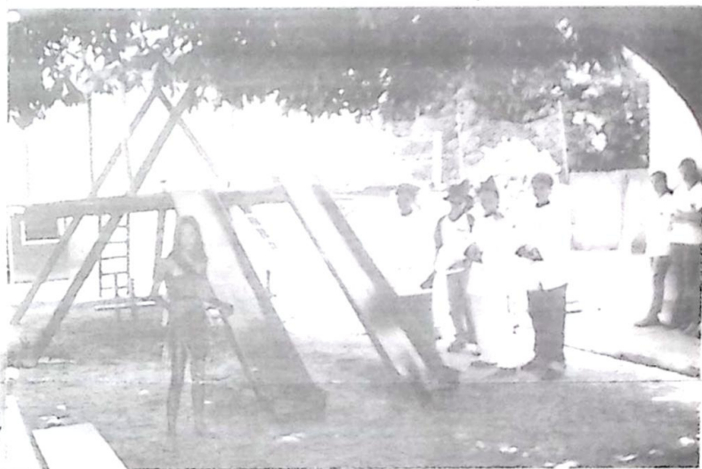
Alunos da 7ª série apresentando um teatro de história "A Chegada dos colonizadores no Brasil IEBV 2003