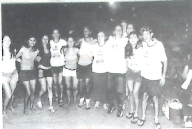
O animado bloco "Bota pra Quebra".