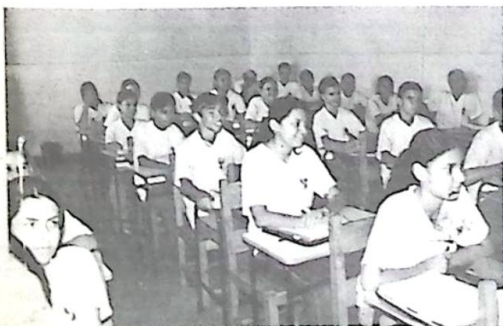
Alunas do 1º ano do ensino médio em sala de aula IEBV 2003

Mas um caráter tal não é obra do acaso, não se deve a favores especiais da providência. Um caráter nobre é o resultado da disciplina própria, da sujeição da natureza inferior pela superior. Aluno do I.E.B.V.