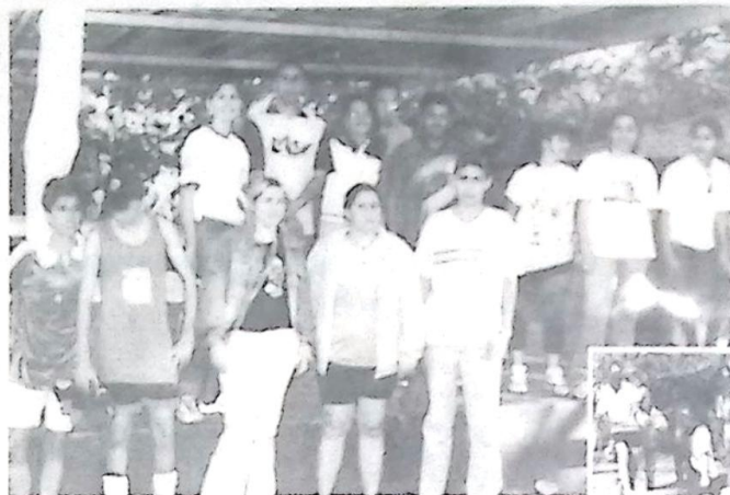
Alunos campeões da "Caça ao Tesouro", juntamente com os professores.