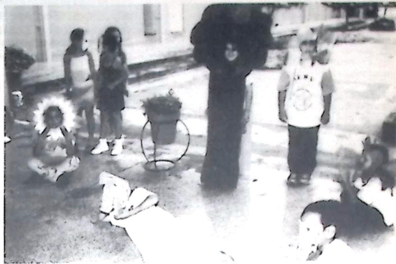
Dramatização dos alunos da 2ª série do livro: "O jacaré e o sapo".