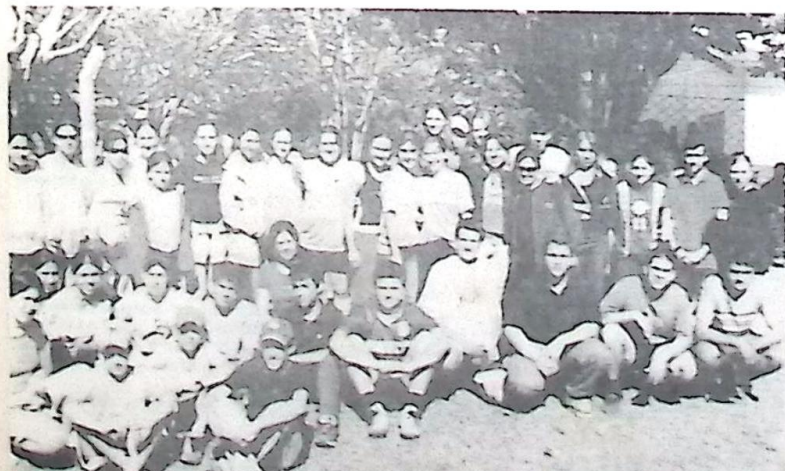
Alunos do Ensino Médio e Fundamental.