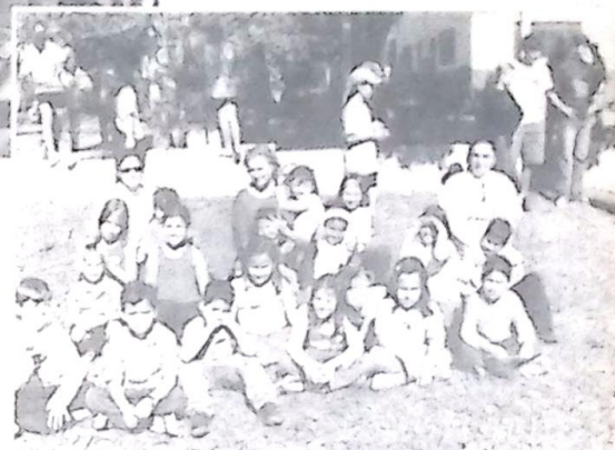
Alunos do Ensino Fundamental do Colégio Cefron com os professores.