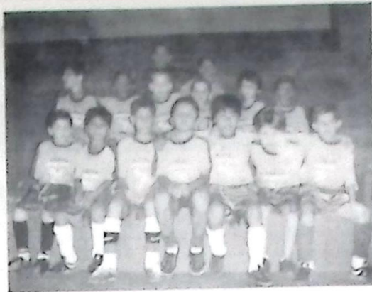
FUTEBOL - Flagrante de uma das equipes que participou do Torneio no Ginásio de Esporte Tulio Loureiro no final de semana pp