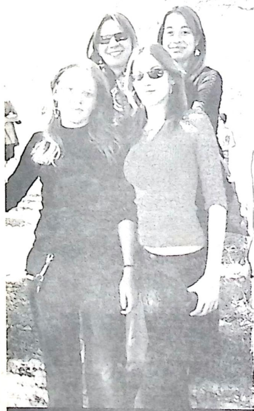
Destaque para as alunas do Ensino Médio.