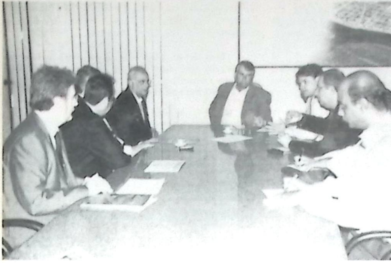
Criação do conselho foi definida em reunião na Governadoria

O governador Zeca do PT e o presidente da República, Luiz Inácio Lula da Silva, empossam em Corumbá, no dia 11 de outubro (aniversário de 26 anos da criação do Estado), os membros do Conselho Pró-Implantação do Pólo Gasquímico Binacional no município.