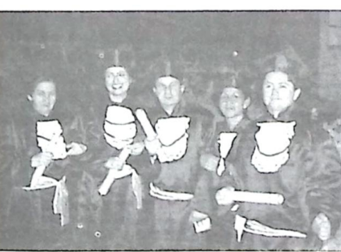
FORMATURA - Dos bela-vistenses na Universidade Estadual de MS na cidade de Jardim