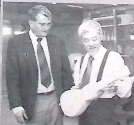
Zeca do PT apresentou Luiz Gushiken com uma viola-de-cocho